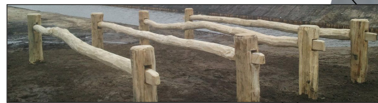
Natuurlijke nietjes voor de crossfit baan (in ontwerp dichter bij elkaar)