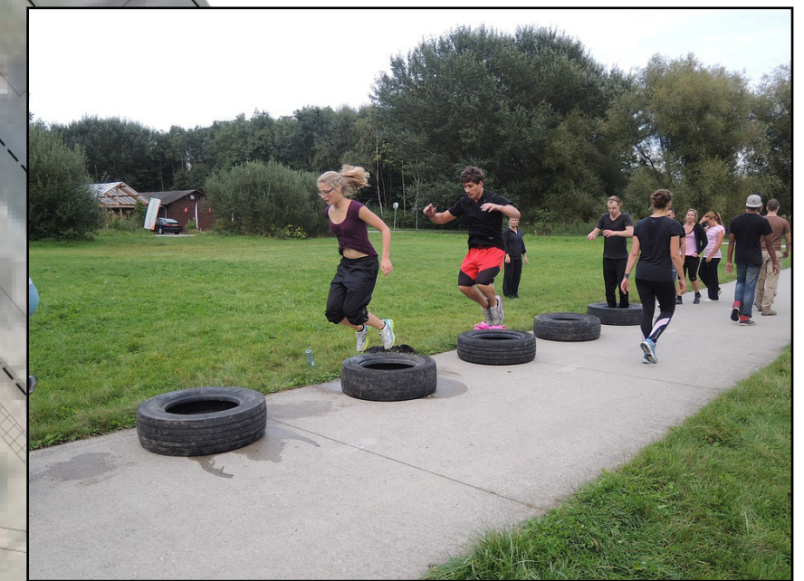
Oefeningen met autobanden