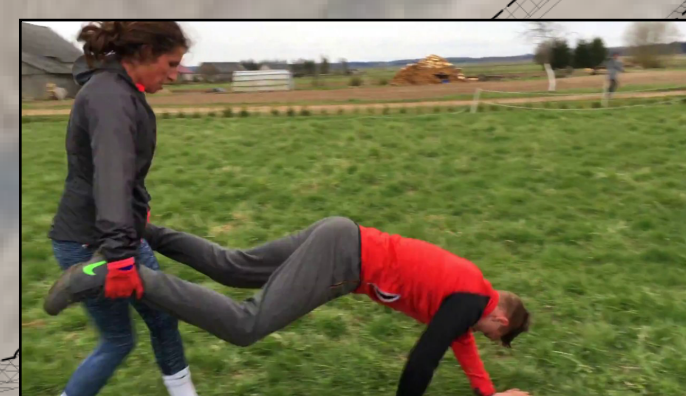
Oefeningen zonder toestellen