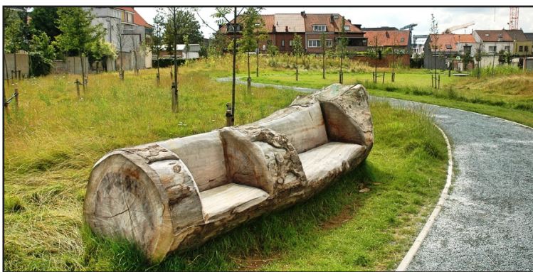
Natuurlijke banken om te rekken en oefeningen te doen