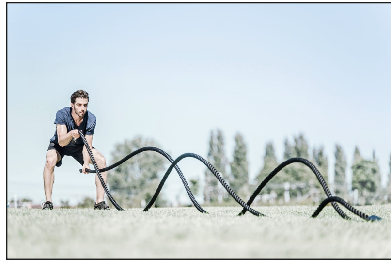
Touwen om mee te werken