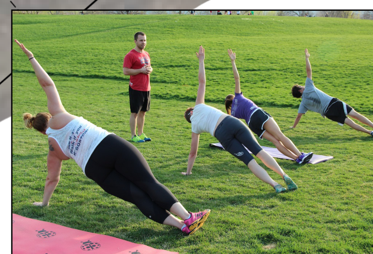
Rekken en strekken op een open veld