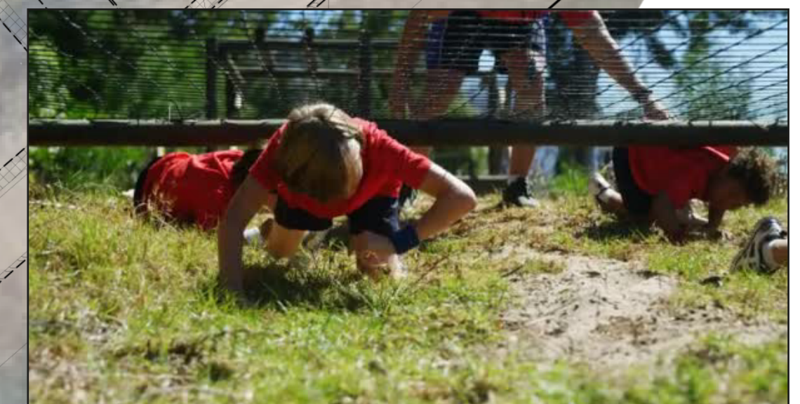
Kruipnet (met grote gaten om ook overheen te lopen)