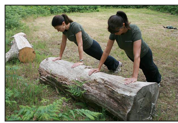
Liggende stammen om op te drukken