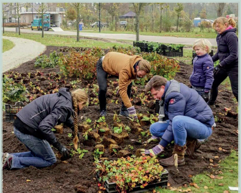
Bewoners helpen bij de aanleg van de Blauwe loper

De afgelopen periode heeft Hoek Hoveniers diverse delen van het terrein verder ingericht. Voor gebouw Bernadette is het park aangelegd. Er is gras ingezaaid en bollen en andere planten zijn aangeplant. Door de werkzaamheden rond het park zijn de wegen soms behoorlijk vervuild. Er wordt geprobeerd om de wegen regelmatig te vegen zodat deze goed begaanbaar blijven. Door de afgelopen periode met vorst en sneeuwval moesten de wegen regelmatig worden gestrooid of zelfs een enkele keer worden vrij geschoven. Ook deze werkzaamheden worden uitgevoerd door de hovenier. Zodra er geen vorst meer is, worden ook de paden voorzien van een nieuwe toplaag. De planning is om medio mei het Hoofdgebouw Front (Paviljoen Sturmia) gereed te hebben, zodat de kopers kunnen starten met de afbouwwerkzaamheden aan deze woningen. Vanaf dat moment zal de oudbouw gelegen aan de Pauluslaan vanaf het toegangshek tot en met Bernadette verder worden afgewerkt. Enkele plantensoorten kunnen nu niet worden aangeplant, maar zullen later in het plantseizoen worden aangebracht. Ook is begonnen met het uitkappen van het terrein, waardoor het ontwerp van de kavels langzaam zichtbaar wordt. Er worden regelmatig ook enkele bomen gekapt op kavels, waar kopers binnenkort zullen starten met de bouw van hun woning. Heeft u vragen of een aandachtspunt, laat het gerust aan de servicemanager weten.